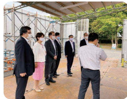
大分市PCRステーションを視察する公明党大分市議団(令和2年6月9日)

令和2年5月18日から運用が開始されている「大分市PCRステーション」を視察し、検査方法等の説明を受けました。未だ、収束の見えない新型コロナウイルスの猛威から、市民の皆様をお守りできるよう、公明党大分市議団は団結して取り組んで参ります。