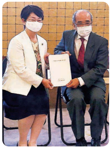
2020年11月17日 広瀬知事へ要望提出

今回で43回目となる公明党県女性局から県への予算要望。毎年、市民の皆さまの声を直接県知事へ届けています。これまで、障がい者の医療費の自動償還払いや、がん治療に伴う外見の変化を補整する器具購入費用の助成など、数々の声が政策へと実現しました。