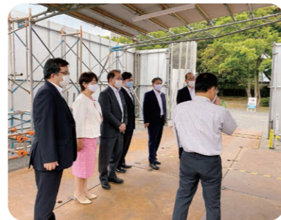
大分市PCRステーションを視察する公明党大分市議団(令和2年6月9日)

令和2年5月18日から運用が開始されている「大分市PCRステーション」を視察し、検査方法等の説明を受けました。未だ、収束の見えない新型コロナウイルスの猛威から、市民の皆様をお守りできるよう、公明党大分市議団は団結して取り組んで参ります。